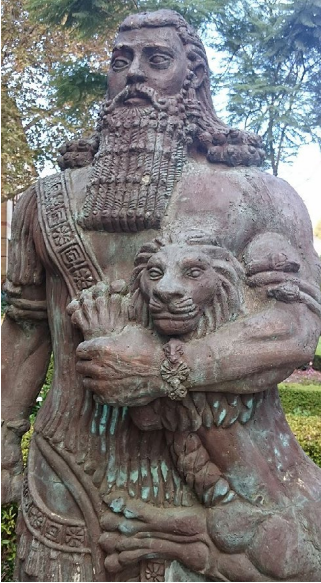
Sydney Üniversitesi kampüsünde yer alan modern Gilgamesh heykeli. Bu heykelde Gilgamesh'ın aslanla olan savaşından galip ayrılması temsil edilmiştir.