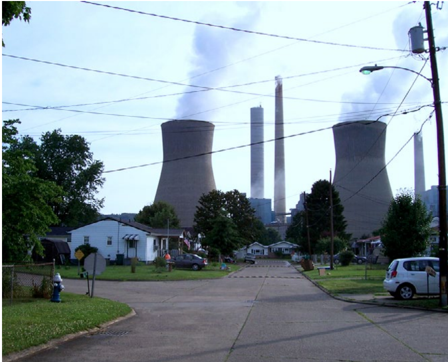
John E. Amos Termik Santrali gölgesinde kentten bir görünüm, Poca, Batı Virginia.