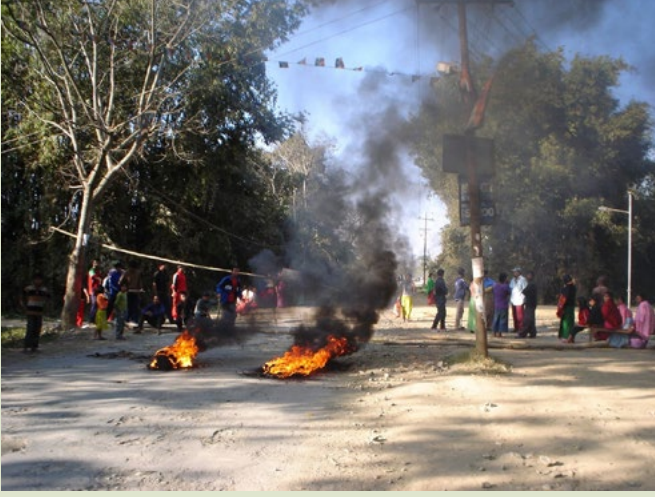
Protestolarda buna benzer görüntüler sıklıkla yaşanmaktadır.