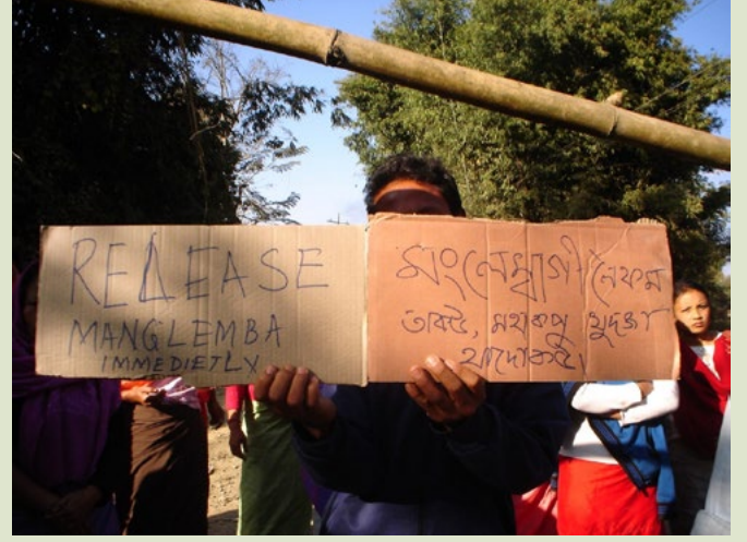
2011 yılında Hindistan ordusu tarafından rastgele alıkonulan genç bir adam için düzenlenen protesto.