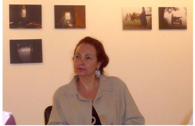
Mona Abaza, The Cotton Plantation Remembered kitabındaki fotoğraflardan oluşan serginin ziyaretinde.

5 Temmuz 2021'de dünya önemli bir sosyoloğu kaybetti. Mona Abaza, iki yıldan uzun süredir savaştığı kansere yenik düştü. Ömrünün sonuna kadar, hayatını dolu dolu yaşamaya kararlıydı, siyaset ve pandeminin git-gellerini takip etti; arkadaşlarıyla vakit geçirdi. Sonu gelmeyen acılarla birlikte çoklu organ yetmezliği yaşamasına rağmen, Berlin'deki yatağından Kahire Amerikan Üniversitesi'nde ders vermeye devam etti. Parlak kariyeri, kırsal Mısır'daki kadınlar, İslam ve Batı arasındaki ilişki, kentli tüketici kültürü, Mısır resim sanatı ve Arap Baharı üzerine çalışmalarıyla anılmaktadır.