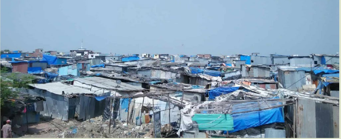
Mumbai'nin banliyösünde yer alan, şehrin en büyük katı atık sahası Deonar'ın önemi gün geçtikçe artmaktadır.

Shireen Mirza, Delhi Indraprastha Bilgi Teknolojileri Enstitüsü, Hindistan