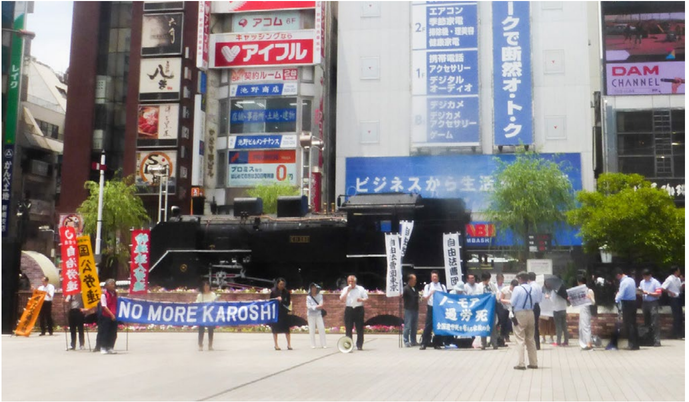
2011'de Shimbashi, Japonya'da "No more karoshi" (fazla çalışma nedeniyle ölüm) eylemi.