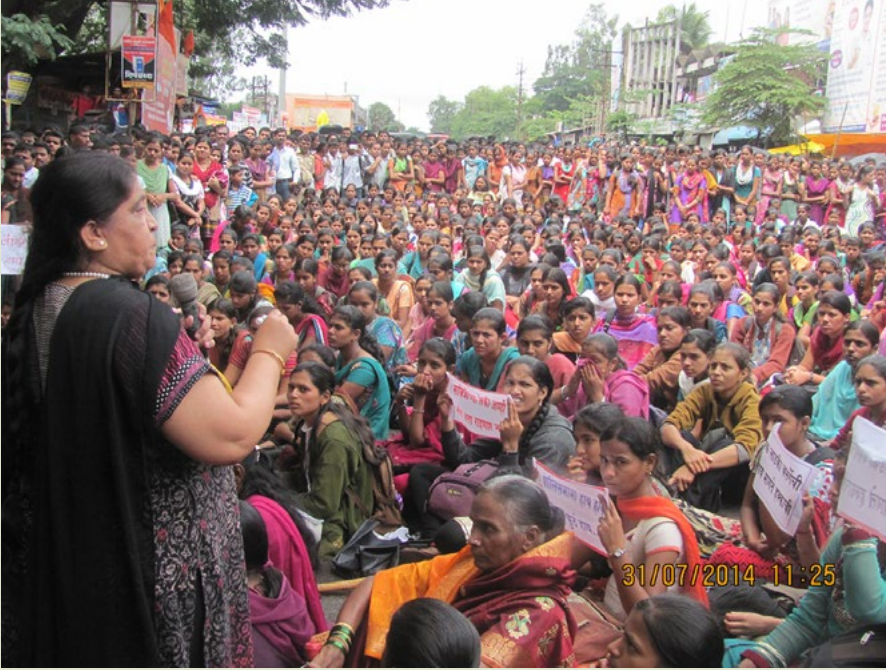
2014 yılında Maharashtra eyaletinin Gadhinglaj-Kolhapur şehrinde kadına yönelik şiddet protestosunda yaşanan gerginlik.